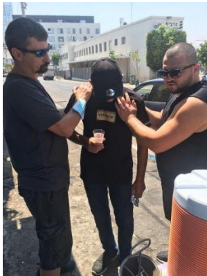
Gebed op straat

We prijzen de HEERE dat de outreach in Tel Aviv doorgaat en er dagelijks veel mensen naar het AVIV Center komen. Blijft u alstublieft bidden voor hen en voor onze vrijwilligers.