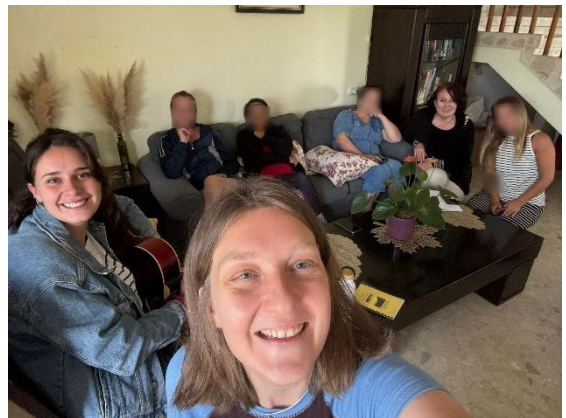
Worship night at the Shelter